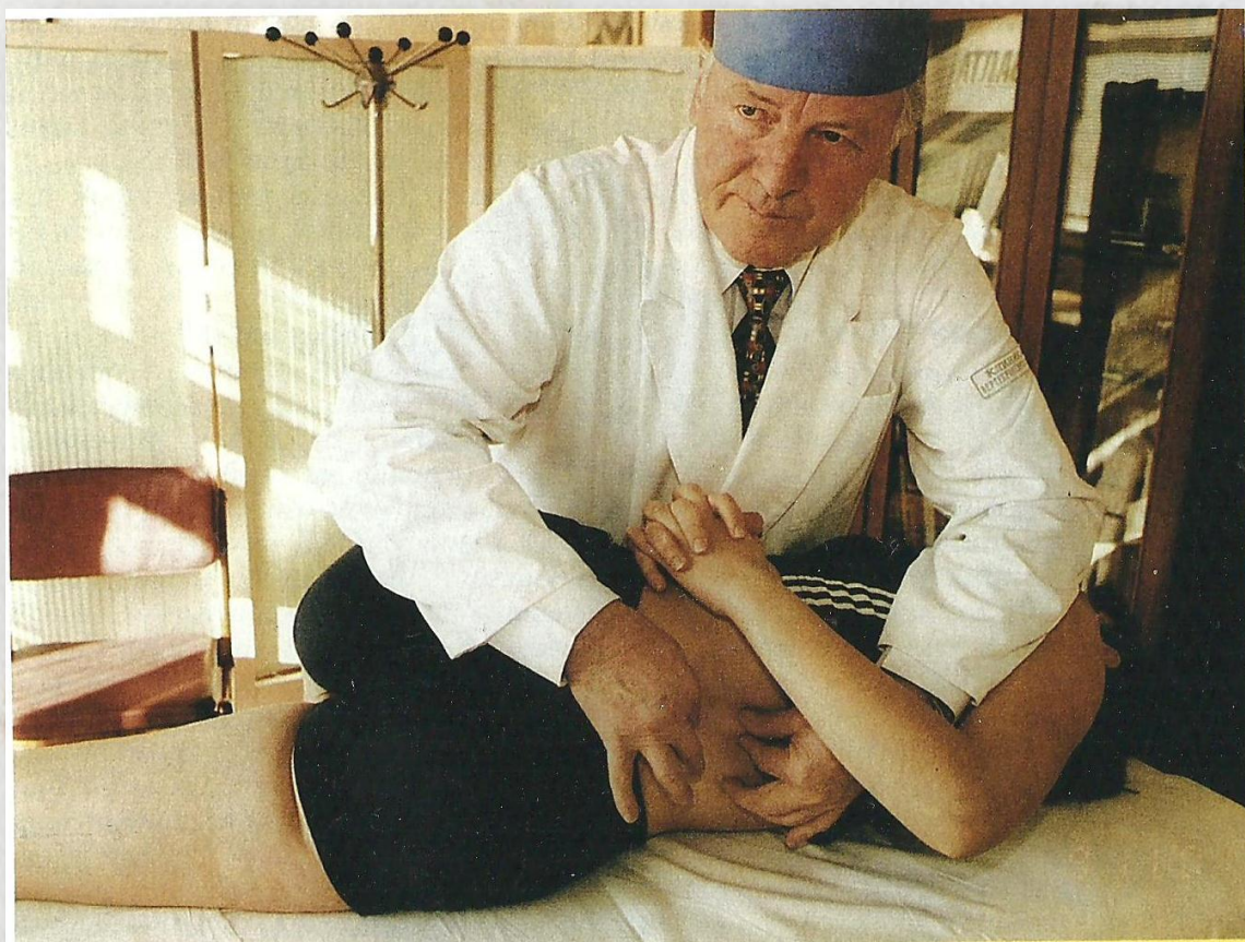
Рабочий момент в клинике вертеброневрологии.