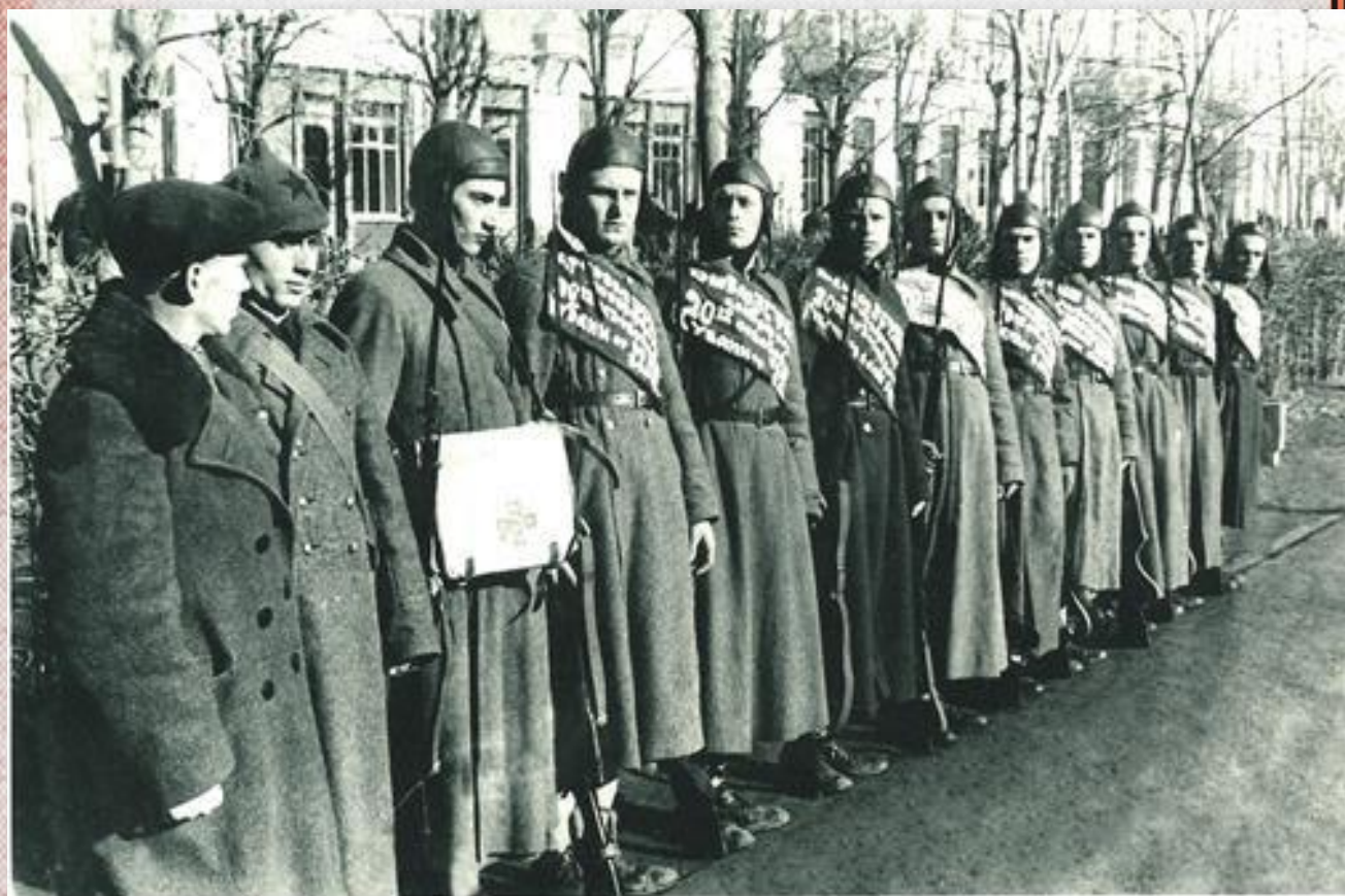
Эстафета Азово-Черноморского края, посвященная 23 годовщине Красной Армии. 1939 год.